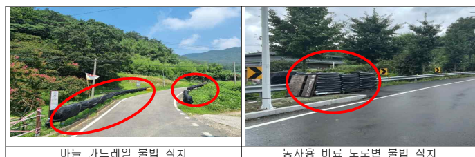
마늘 가드레일 불법 적치