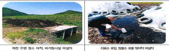
하천 주변 장소 야적 비가림시설 미설치