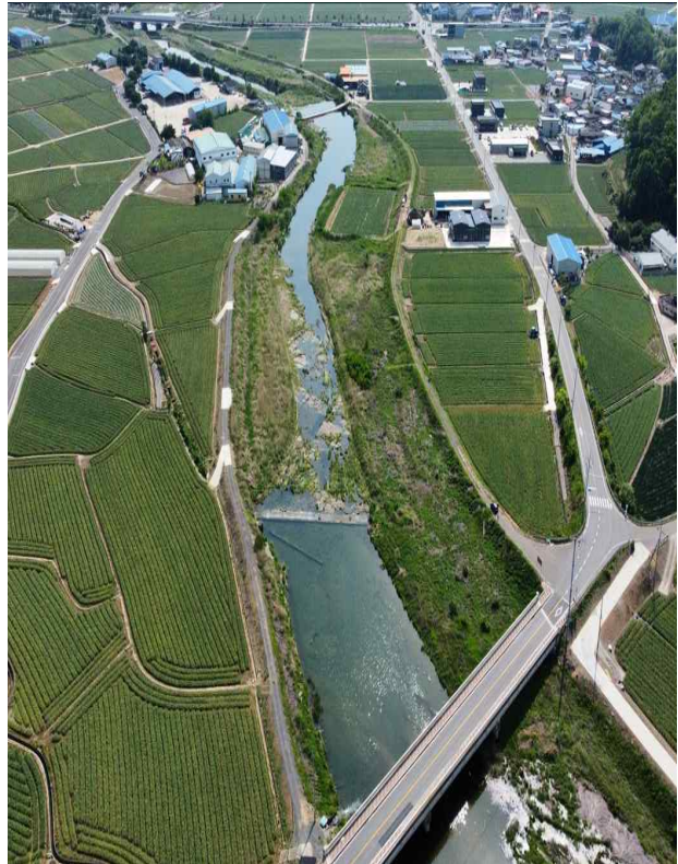
현황사진(대지면 왕산리 만촌교 일원)